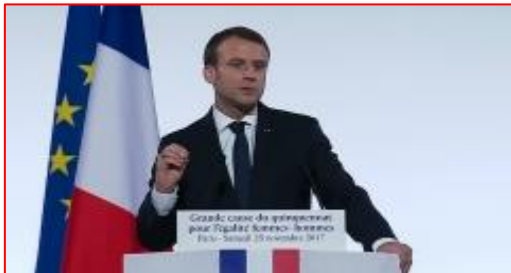
Grande cause du quinquennat Discours du 25.11.2017